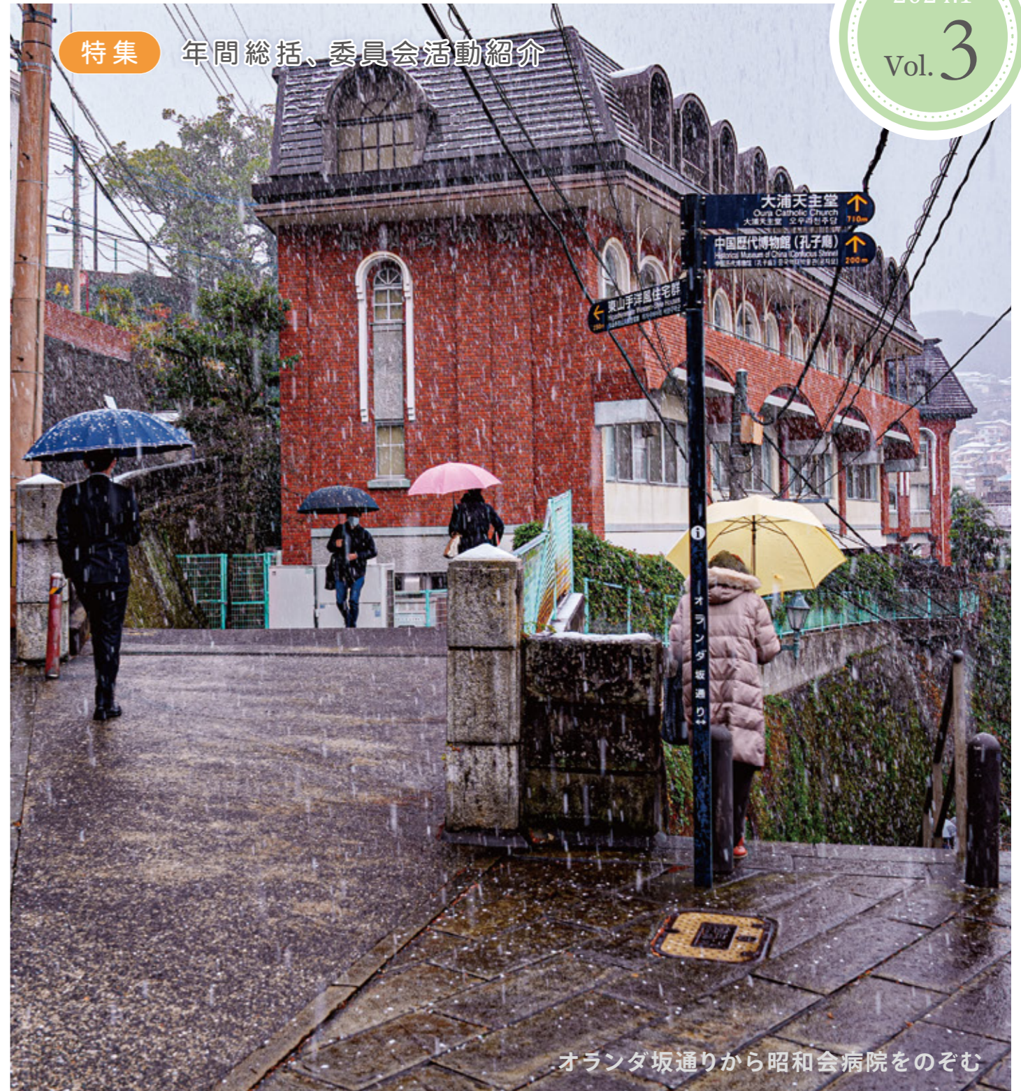
オランダ坂通りから昭代会病院をのぞむ