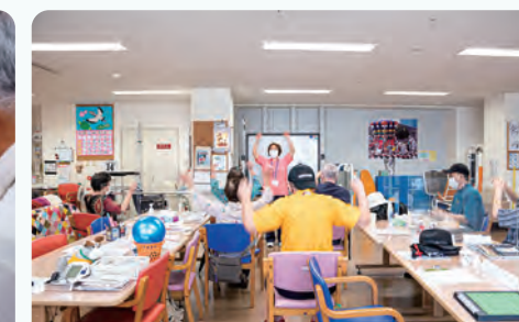
楽しいレクリエーション