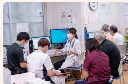
カンファレンスの様子

地域包括ケア病棟が出来て1年が経過しました。 引き続き地域の皆様が、安心して生活できるよう役割を担っていきます。